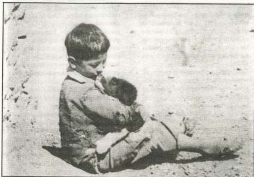
CELADEC, Foto S. Thissen

"Le faltaba al joven educador la convicción de que la educación no sólo se hace de "no", pero jamás sin él. Sólo de "no", no, pero sin "no" nunca. A veces, es muy difícil decir "no", tiene que saberse en que momento. El educador no tiene la posibilidad de escapar, en la práctica educativa, del problema de la libertad, de la permisividad y del autoritarismo".