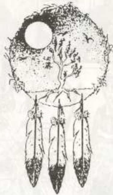
El Acto de la Vela

Eduardo Galeano, "Uxelo y Tirelo", Planeta, pp. 27-28.