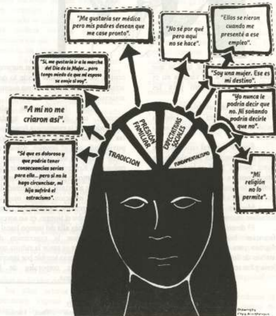
La Tribuna N° 43, Agosto 1994, p.23.