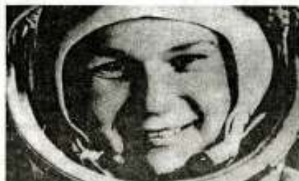
En 1963, la rusa Valentina Tereshkova se convirtió en la primera mujer en viajar al espacio.

*que..... la cosmonauta rusa Valentina Tereshkova , primera mujer que viajó al espacio, fue elegida Mujer del Siglo . Tal distinción le fue entregada recientemente en Londres por la Asociación Internacional de la Mujer de Año , creada en 1955, la decisión fue unánime por una gran cantidad de votos a favor de la rusa que hoy tiene 63 años. La asociación basó su elección en la lucha que Tereshkova dio permanentemente en pro de la igualdad de los sexos en la ex Unión Soviética. Valentina realizó su único viaje sola a bordo de la nave Vostok-IV en Junio de 1963; un cráter de la luna tiene su nombre. Luego presidió la Comisión de Mujeres del Soviet Supremo de 1968 a 1987 y ahora dirige el Centro Internacional Ruso de Cooperación Cultural y Científica .