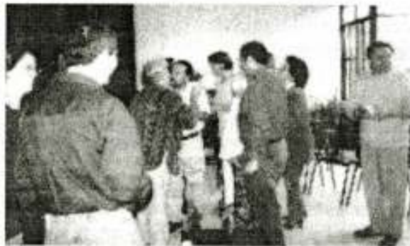
Saludo de la Paz, final del devocional de celebración por los 25 años de la WACC

Durante el primer día, luego de un devocional de apertura, reflexionamos sobre la temática del Congreso 2001 en el contexto de las experiencias de comunicación en cada uno de nuestros grupos. Desembocamos así en las conferencias públicas que se realizaron en el Museo del Área Fundacional de la ciudad con la participación de estudiantes universitarios y representantes de los organismos de derechos humanos locales.