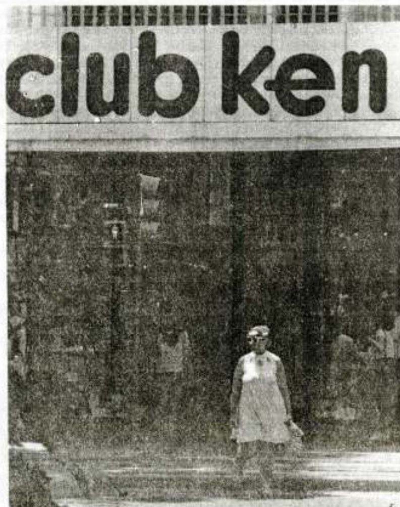
"A LA MODA"

*que.....Lunes 4 de Diciembre 2000 es Día Internacional de los Discapacitados.... La organización Mundial de la Salud calcula que casi el 10% de la población mundial - casi 500 millones de personas - tienen algún tipo de discapacidad. Debemos tomar conciencia que el Discapacitado es discriminado y que todos debemos garantizar la igualdad de oportunidades para ellos, renovando nuestros esfuerzos para hacer cumplir con las normas vigentes.