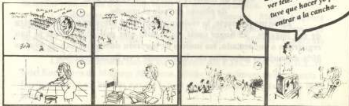
"De Igual a Igual" (Instituto de la Mujer)

por parte de la esposa del apellido del esposo; la ley de cupos.