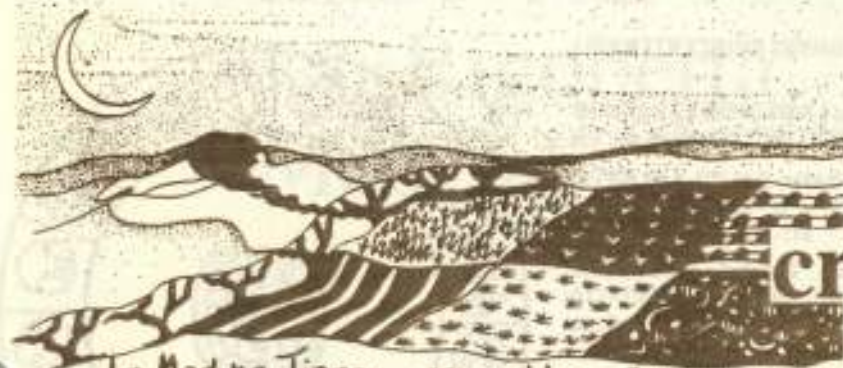
La Madre Tierra -receptiva

Todas las mujeres de nuestra aldea habíamos estado esperando ese atardecer en el que, sobre el horizonte, se dibujara el tenue hilito plateado de la luna creciente. Ya en los días de esta espera habíamos abierto las envolturas en que guardamos de cada planta y hierba, las semillas mejores de la cosecha anterior. Con un gesto casi ritual selec- cionamos aquellas que rebotaban de “vida” y las poníamos en las bolsitas preparadas para el día de la siembra. Precisamente este día en que vuelve a asomar de nuevo nuestra Señora Luna.