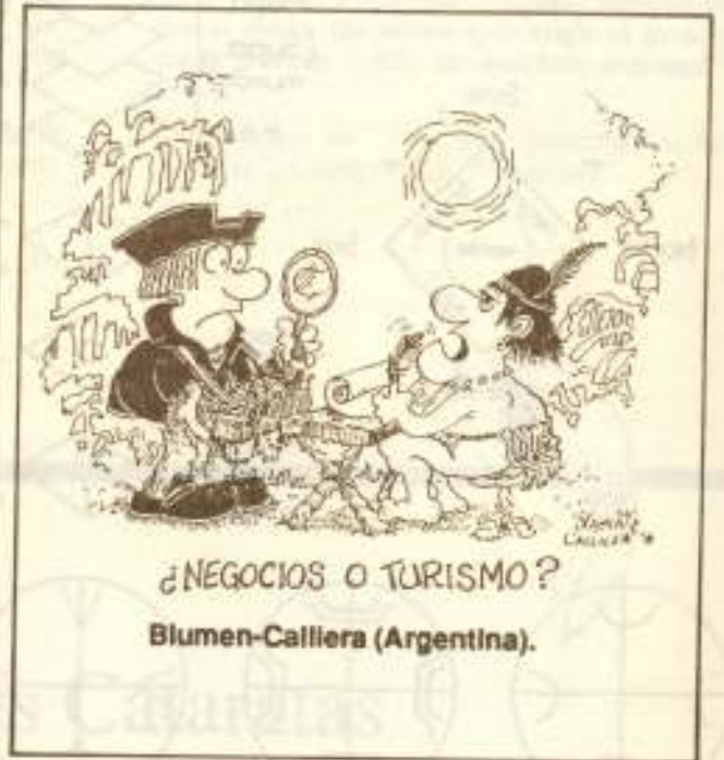
¿NEGOCIOS O TURISMO? Blumen-Calliera (Argentina).