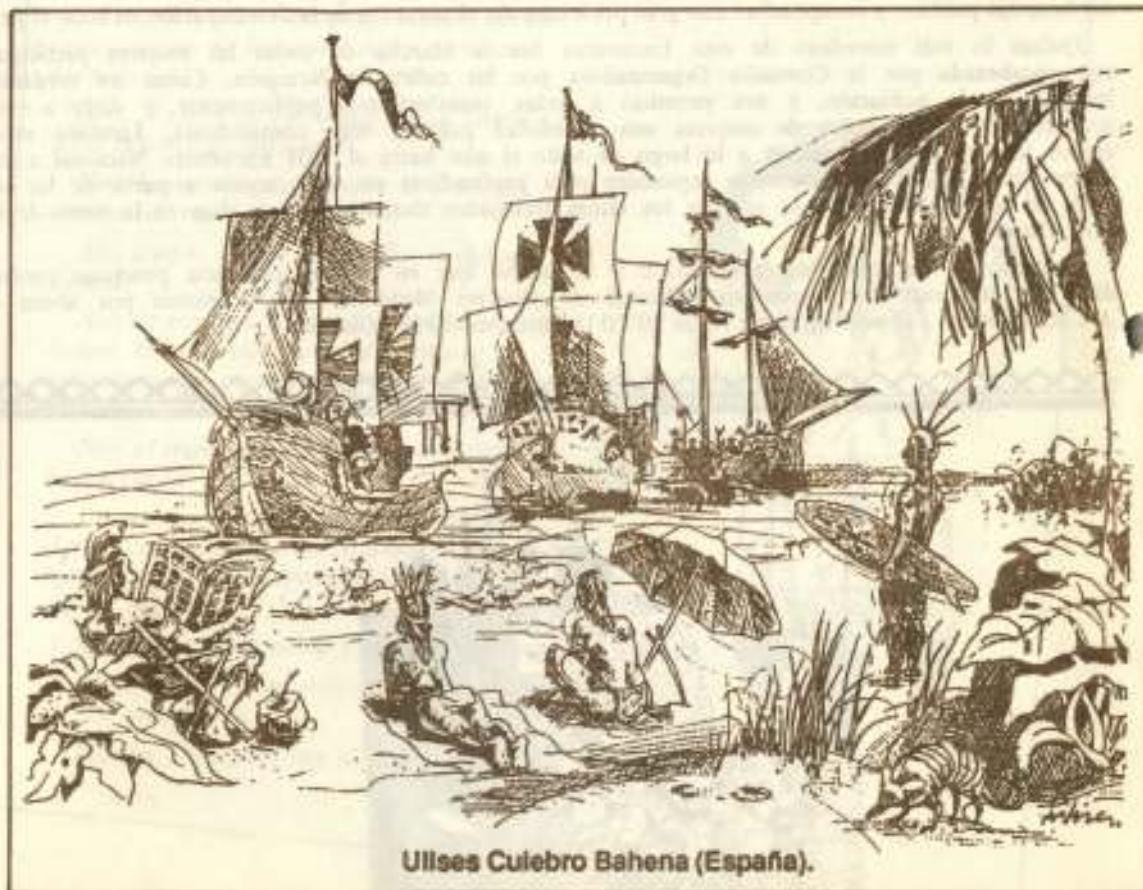
Ulises Culebro Bahena (España).