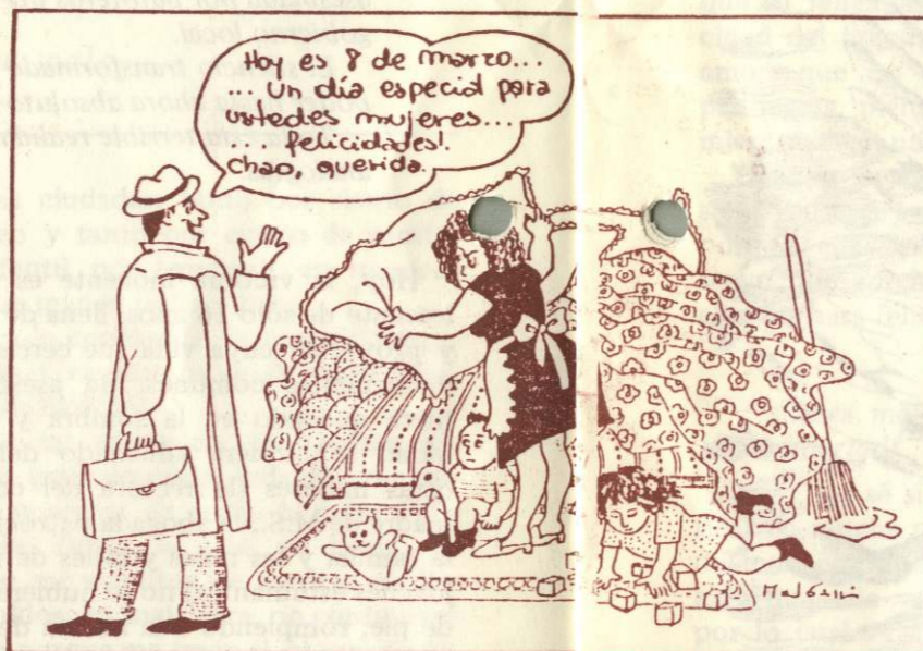
Aspino. J. J. J.

No sabemos qué resultado han tenido estos proyectos hasta aquí, esperamos que hayan recibido trámite favorable y que pronto empiecen a concretarse.