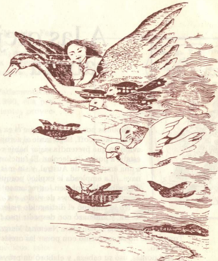
ILUSTRACION DE DELIA CONTARBIO "DE CUENTOS QUE CUENTAN LOS TEHUELCHES"

Hicimos tres preguntas a dos jóvenes, mamás de pequeñas mujercitas. Queríamos saber qué desean, qué esperan ellas para el futuro de sus hijas.