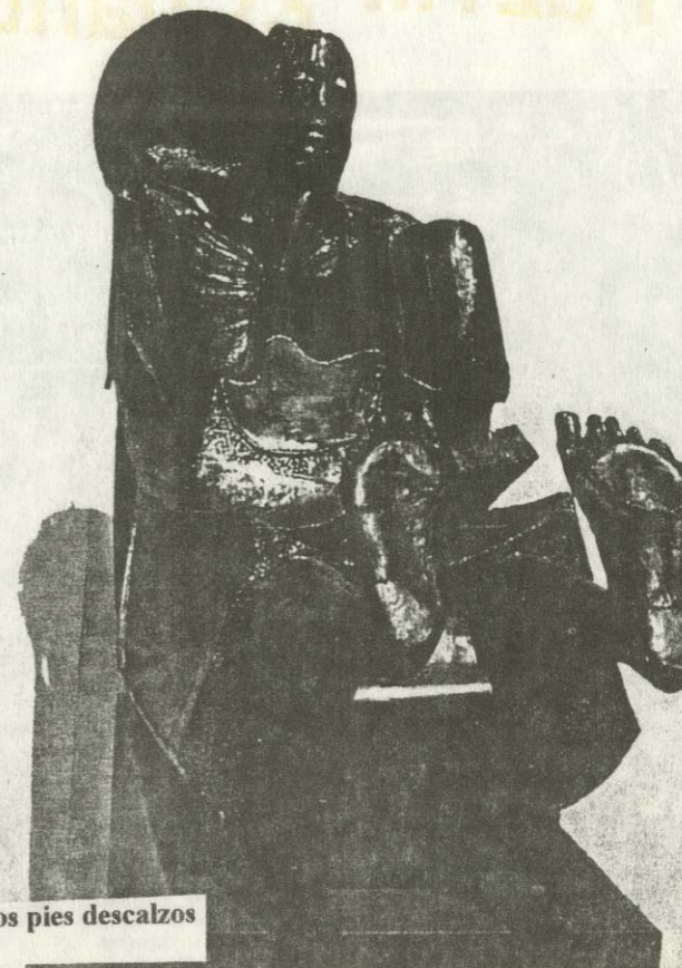
América de los pies descalzos 1,00 x 1,70