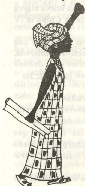
International Women's Tribune

Encuentro Nac. de Mujeres Mendoza CLADEM