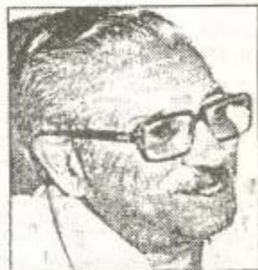
Por el Dr. Roberto Chediack

Todos los días nos asombramos u horrorizamos por el aumento de la violencia social, familiar, suicidios, o la drogadicción, etc..., ante lo cual se pide generalmente más seguridad policial, o programas asistencialistas, que a mi entender son respuestas puntuales, pero no están dentro de políticas integrales. La temática es muy compleja y nadie individual o sectorialmente tiene conocimiento de todas las variables, pero hay que ir tratando de desentrañar todas las causas generadoras, para elaborar políticas como sociedad que nos lleven a vislumbrar un futuro y no una pesadilla. Es muy común que los médicos, psicólogos, hablemos de historias clínicas o las trabajadoras sociales de encuestas sociales, pero los términos me parecen demasiado pequeños, intrascendentes, pues en realidad deberían llamarse historias de vidas.