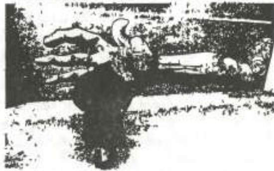
El mural realizado por un grupo de alumnos de la Escuela de Artes Plásticas Poggiolini, La Plata, que conmemora los fusilamientos, quedó tallado en la pared de fondo de la Plazoleta Rodolfo Walsh.

En 1972, en la base naval de Trelew son fusilados 16 militantes políticos, que días antes intentaron fugarse de la Cárcel de Rawson (prov. de Chubut). Hoy un mural en la Plazoleta Rodolfo Walsh (ciudad de Bs. As.) Los recuerda como los primeros mártires identificados.