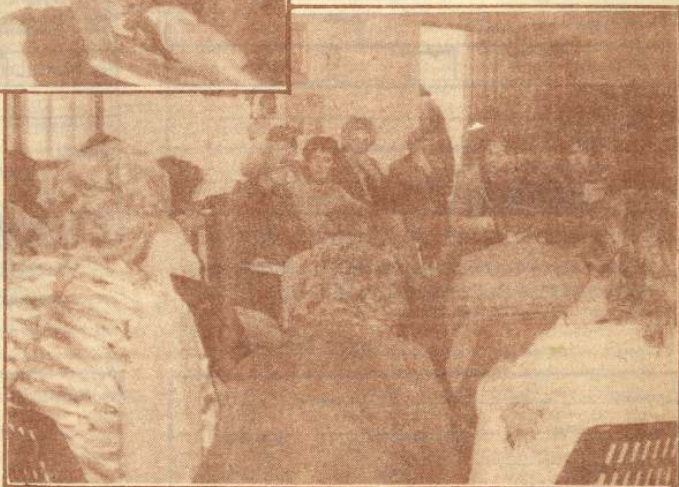
Asistentes al Congreso Mundial comparten su experiencia.

Primero las presentaciones. Cada asistente presentó a su compañera en el tiempo que arde un fósforo.